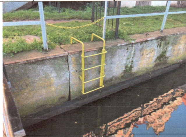
Fot 4. Drabinka wylazowa