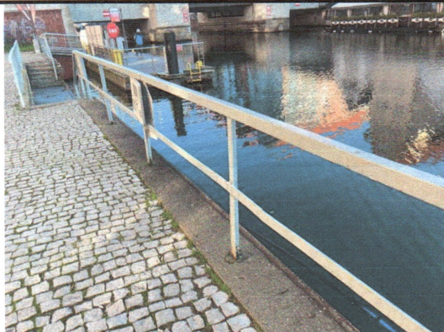
Fot 1. Bariery ochronne

( * załączyć poglądowe zdjęcia w przypadku stanu zagrożenia lub dużych odstępstw i nieprawidłowości )