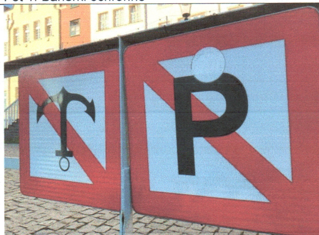
Fot 3. Oznakowanie nawigacyjne